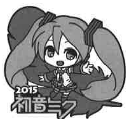
illustration by nekosumi © Crypton Future Media, INC. www.piapro.net piapro