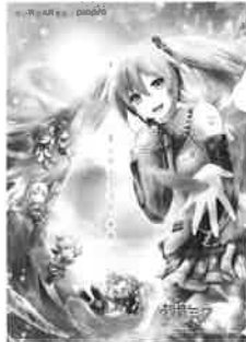
illustration by Raiko © Crypton Future Media, INC. www.piapro.net piapro 〈初音ミク クリアファイルB〉