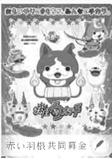
LS/YWP-TX 〈妖怪ウォッチクリアファイルA〉