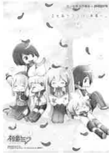
illustration by のくはし © Crypton Future Media, INC. www.piapro.net piapro 〈初音ミク クリアファイルC〉

初音ミク〈クリアファイル〉、妖怪ウォッチ〈クリアファイル〉・〈下敷〉は200円以上の募金、ステッカーは100円以上の募金をしていただいた方に進呈します。