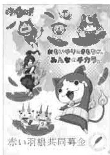
LS/YWP-TX 〈妖怪ウォッチクリアファイルB〉