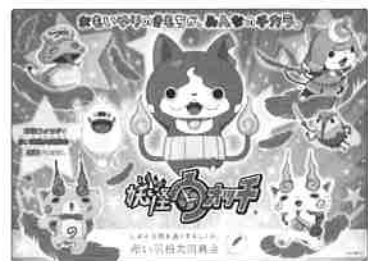
LS/YWP-TX 〈妖怪ウォッチ下敷き〉