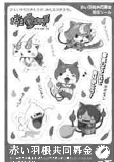
LS/YWP-TX 〈妖怪ウォッチステッカー〉