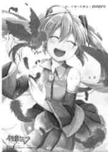
illustration by アイヲ © Crypton Future Media, INC. www.piapro.net piapro 〈初音ミク クリアファイルA〉