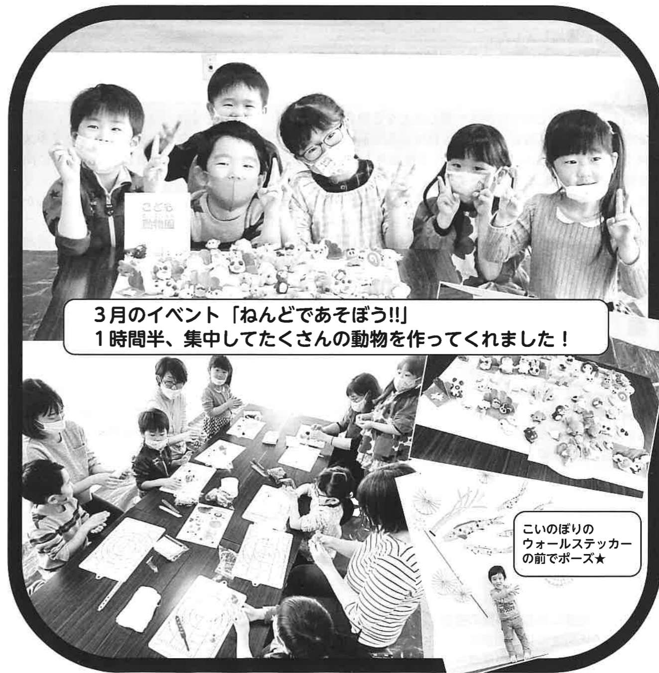
3月のイベント「ねんどであそぼう!!」 1時間半、集中してたくさんの動物を作ってくれました!