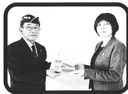
十勝清水ライオンズクラブ様