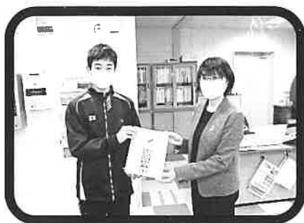
御影中学校生徒会様

新型コロナウイルスで大変な状況の中、赤い羽根共同募金へのご協力ありがとうございました。