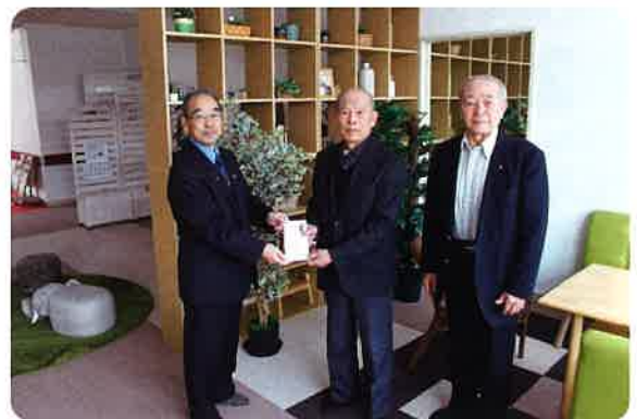
御影カラオケ同好会 様

ハートフル募金 102,998円 日本ハム購買募金 875円 御影カラオケ同好会 25,021円