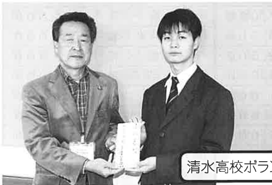
清水高校ボランティア委員会様