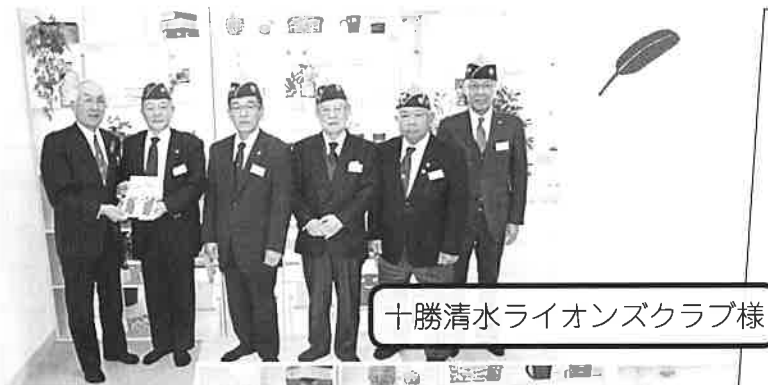
十勝清水ライオンズクラブ様