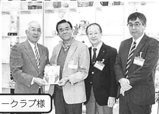
清水ロータリークラブ様