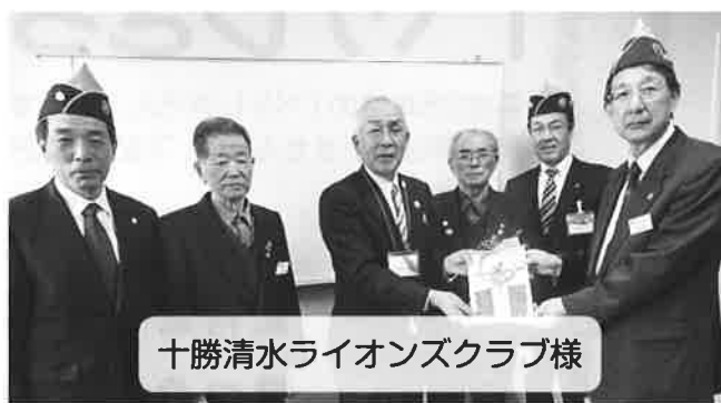
十勝清水ライオンズクラブ様