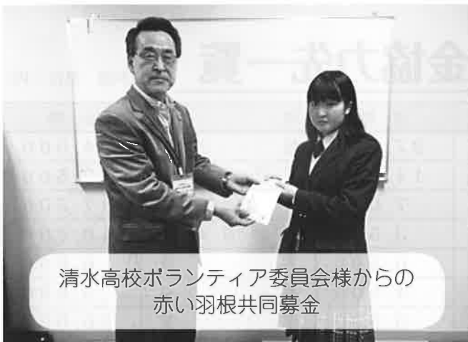
清水高校ボランティア委員会様からの 赤い羽根共同募金