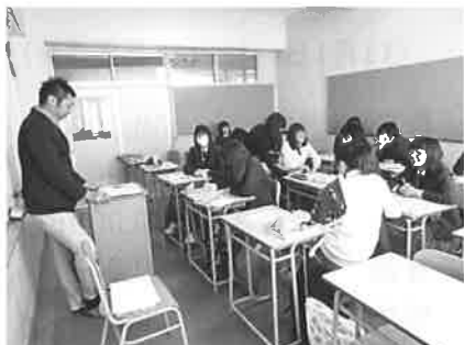
コミュニケーションの講義