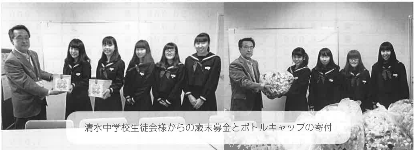
清水中学校生徒会様からの歳末募金とボトルキャップの寄付