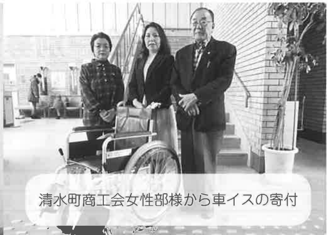
清水町商工会女性部様から車イスの寄付