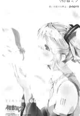
illustration by かぎの © Crypton Future Media, INC. www.piapro.net piapro 〈初音ミククリアファイル C〉