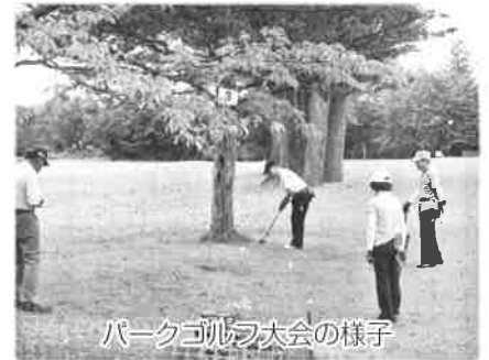
パークゴルフ大会の様子