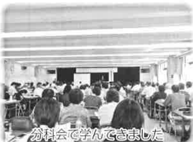
分科会で学んできました

8月27日(土)~28日(日)に全道のボランティア実践者や関心のある方々が一堂に集い、ボランティア活動の課題等について研修をしてきました。交流を通じ、仲間作りやネットワーク作りなど、今後のボランティア活動をより充実したものにするために参加してきました。