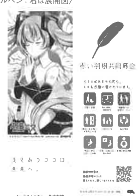
illustration by めぶち © Crypton Future Media, INC. www.piapro.net piapro 〈初音ミク しおり：表・裏〉