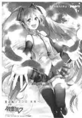
illustration by さきっこ © Crypton Future Media, INC. www.piapro.net piapro 〈初音ミククリアファイル A〉