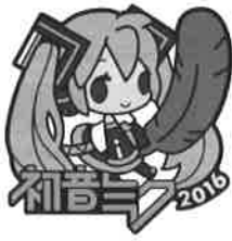
〈初音ミク〉 1個 500円

クリアファイル、下敷き、鉛筆は200円以上、ステッカーは100円以上の募金をしていただいた方に進呈します。 グッズをご希望の方は募金の際にお申出下さい。 募金グッズは清水町共同募金委員会窓口でのみ取扱っています。※数量に限りがございます。無くなり次第、終了となります。