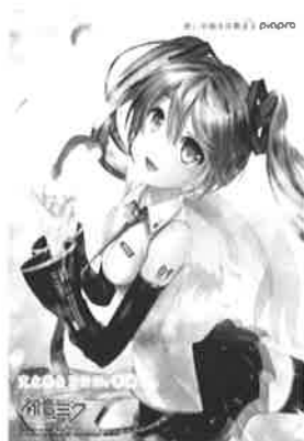
illustration by 白羊 ゆき © Crypton Future Media, INC. www.piapro.net piapro 〈初音ミククリアファイル B〉