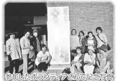
参加したボランティアさんで記念写真