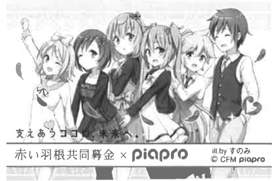
illustration by すのみ © Crypton Future Media, INC. www.piapro.net piapro 〈初音ミク ボールペン：右は展開図〉