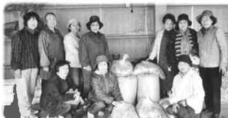
清水町ボランティア団体連絡協議会の皆さんとリングプルの選別・梱包作業の様子