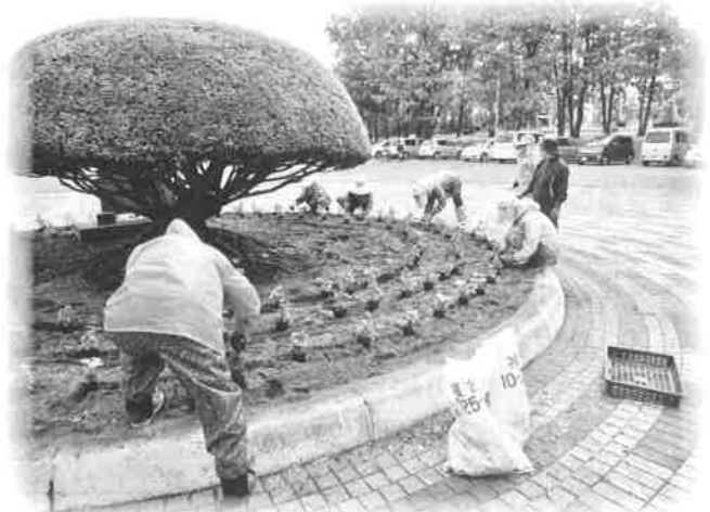
清水町老人クラブ連合会の活動（西部十勝4町ゲートボール大会、女性部の社会奉仕活動（花壇整備）の様子