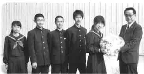
清水中学校生徒会書記局皆さん

◎清水町ボランティア団体連絡協議会が6月16日(木)にリングプルの選別・梱包作業をしました