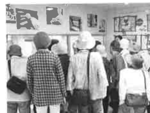
柳月「スイートピアガーデン」見学