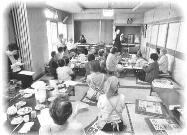
地域交流サロン活動の様子（左：ペケレの会「ペケレさろん」、右：たんぼほの会「ふれあいサロン」）