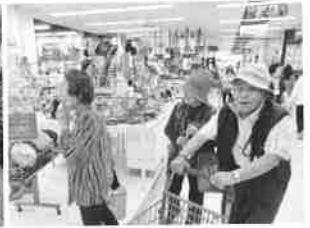
買物「ドン・キホーテ」