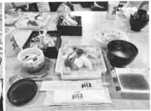
お食事のメニュー