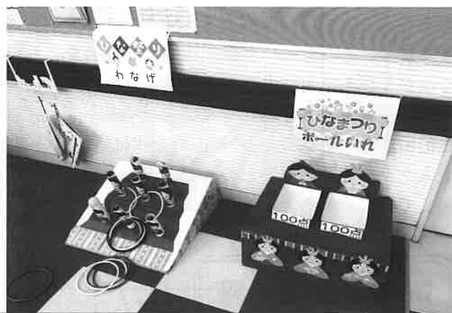
3月3日開催の「つどいの場ひな祭り」の様子