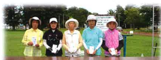
第12回 清水町社会福祉協議会 パークゴルフ大会