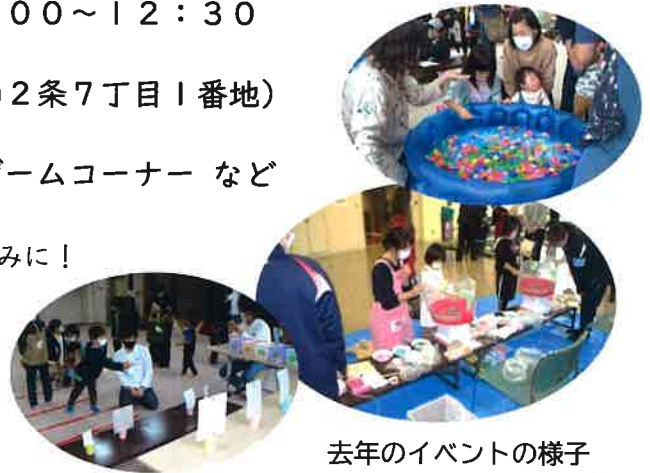
去年のイベントの様子

イベント当日は楽しいことを沢山用意する予定です！お楽しみに！ 去年は大雨だったので…今年は晴れますように…！！