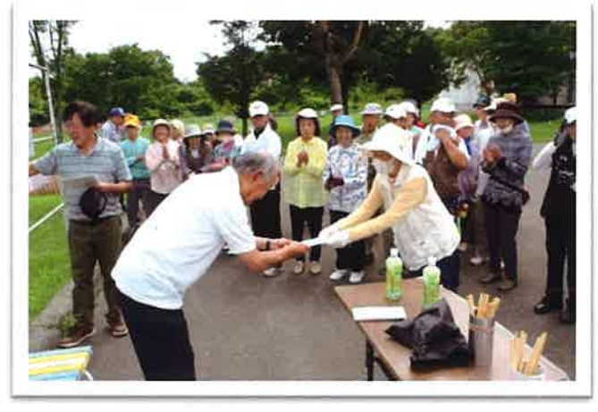
清水町社会福祉協議会主催第12回パークゴルフ大会の様子