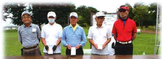
第12回 清水町社会福祉協議会 パークゴルフ大会