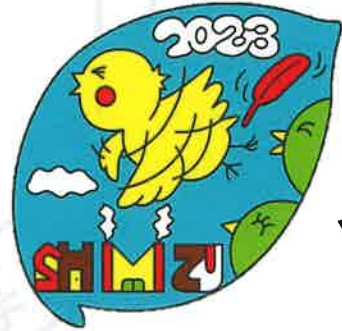
今年の清水町限定デザイン