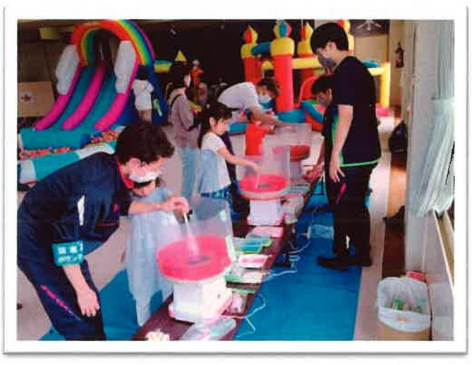
つどいの場ボールプールミニイベントの様子