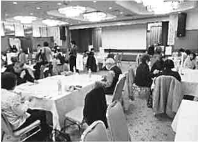
分科会(グループワーク)の様子

午後からの分科会では、「災害から見える、これからのボランティア活動とは」「身近な支え合い「認知症、と人と人」「みんなで出来るレクリエーション」という3つの会場に分かれ、それぞれ講演やグループワーク・実技を行いました。